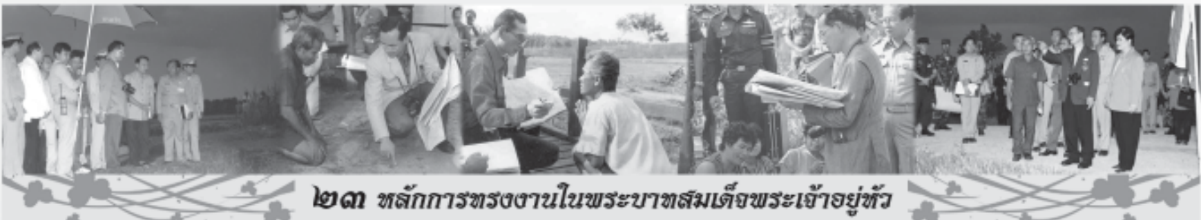
๒๓. หลักการทรงงานในพระบาทสมเด็จพระเจ้าอยู่หัว