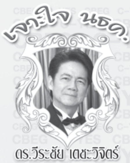
(ต่อจากแทรกรพิเศษ “อินไซด์ นธค. ฉบับที่ 64)